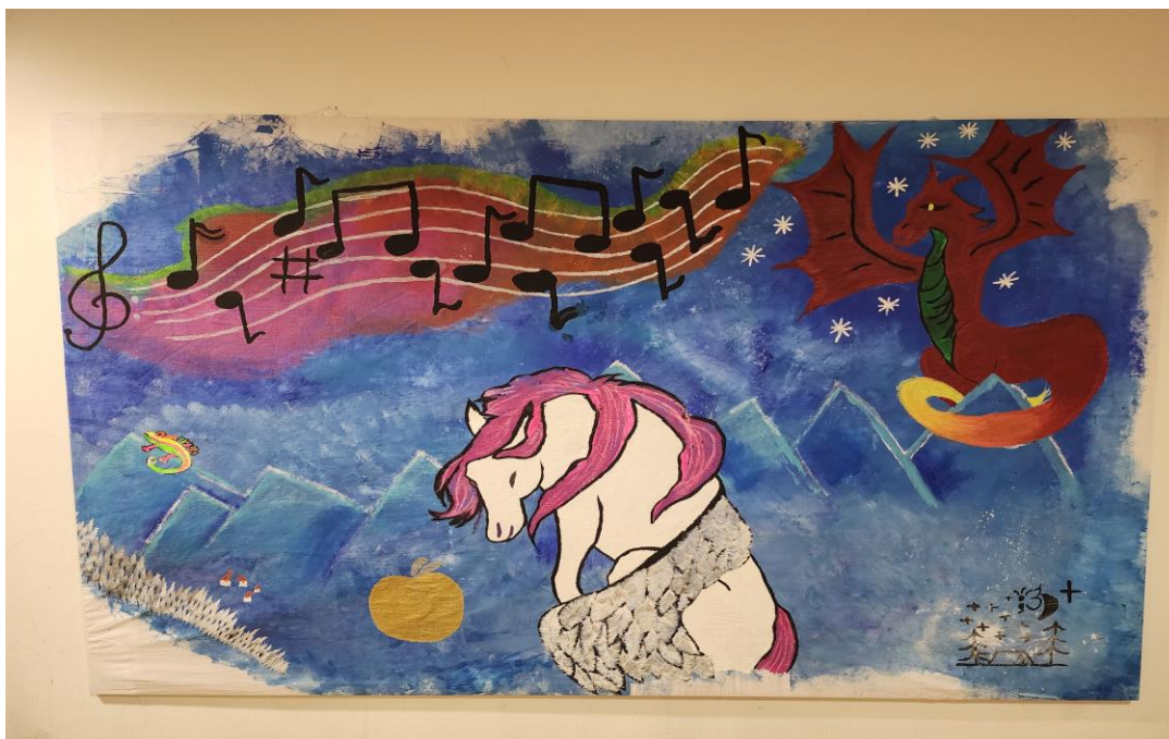
Gemeinsames Werk von Patient:innen aus dem Behandlungszentrum Sucht im Rahmen der Kunsttherapie (2023)

Das „Haus Löwenherz“, die Klinik für Kinder- und Jugendpsychiatrie, Psychotherapie und Psychosomatik in Stralsund lädt am 19.06.2026 zum Fachtag des Behandlungszentrums für Kinder und Jugendliche mit Suchterkrankungen ein.